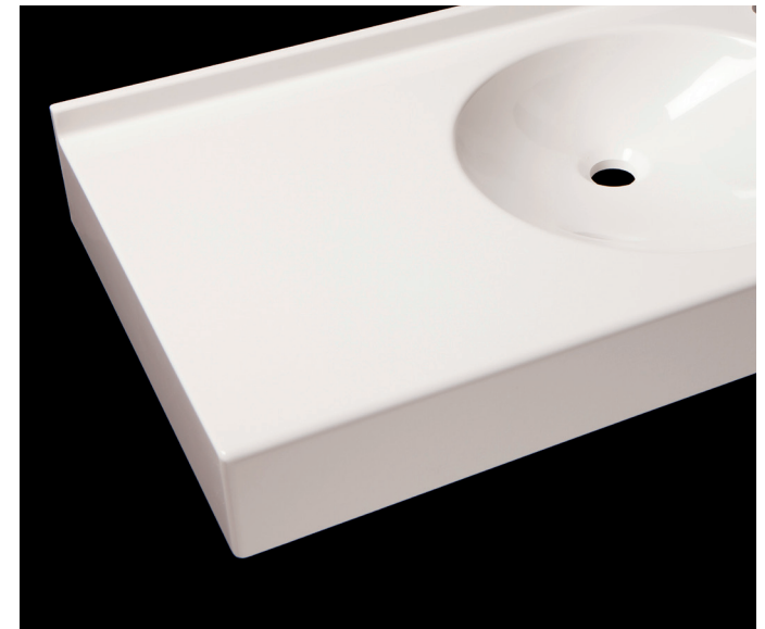
EXEMPLE: FLORIDE MR