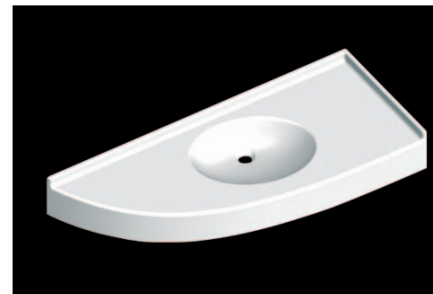
MODELE POINTE A GAUCHE

BONDE EN 32 VASQUE 460X350 / PROF.100 AVEC OU SANS TROP PLEIN ROBINET COTE ANGLE DROIT AVEC POINTE A DROITE OU POINTE A GAUCHE SANS JOUE COTE DOSSERET